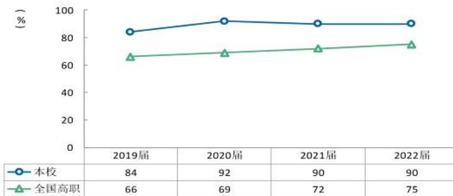
2022 届毕业生半年后就业满意度对比图 (%)